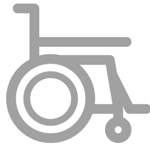
специальные технические средства